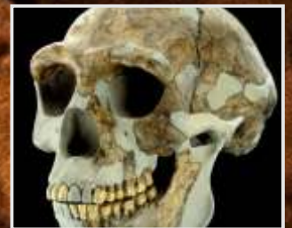
El primer hombre en América