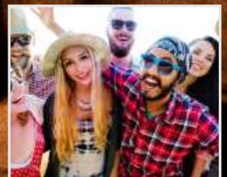
Millennials, la generación actual