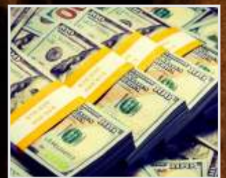
¿Qué es preferible, lo útil o lo justo?