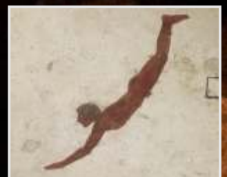
Un nadador en la Grecia antigua